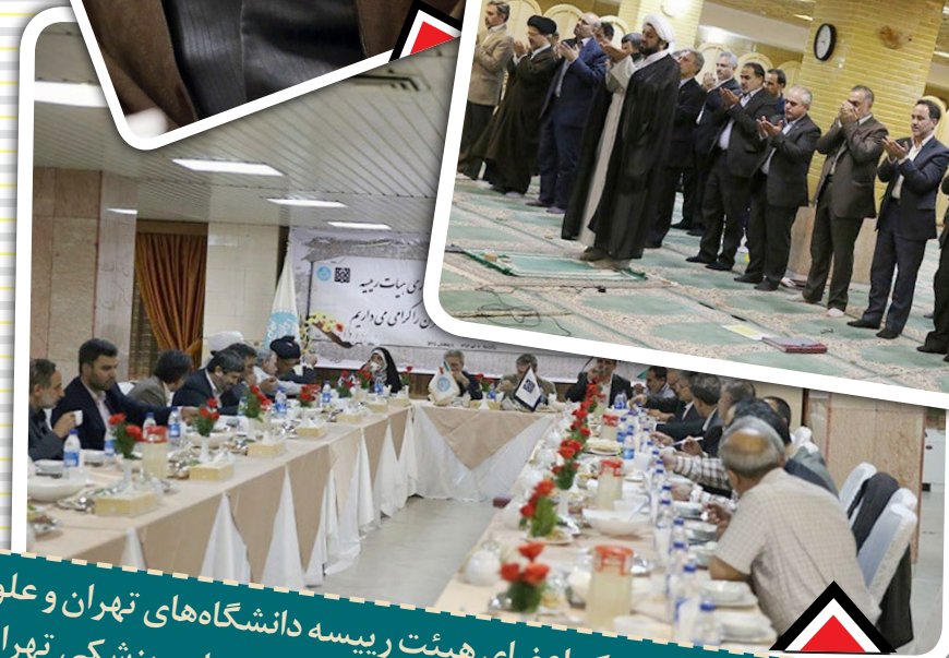
سومین نشست مشترک اعضای هیئت رئیسه دانشگاه‌های تهران و علوم پزشکی تهران - ۷ تیر ۹۴ - ستاد مرکزی دانشگاه علوم پزشکی تهران