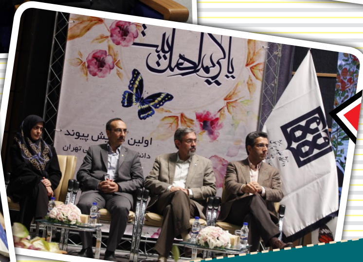
نخستین همایش پیوند چهارشنبه ۱۰ تیر ۹۴ - ستاد مرکزی دانشگاه