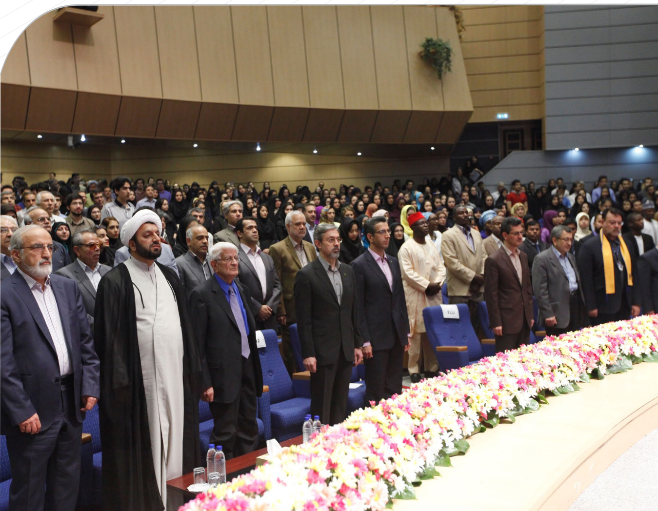
برگزاری آیین بازگشایی دانشگاه‌های علوم پزشکی کشور با حضور وزیر بهداشت