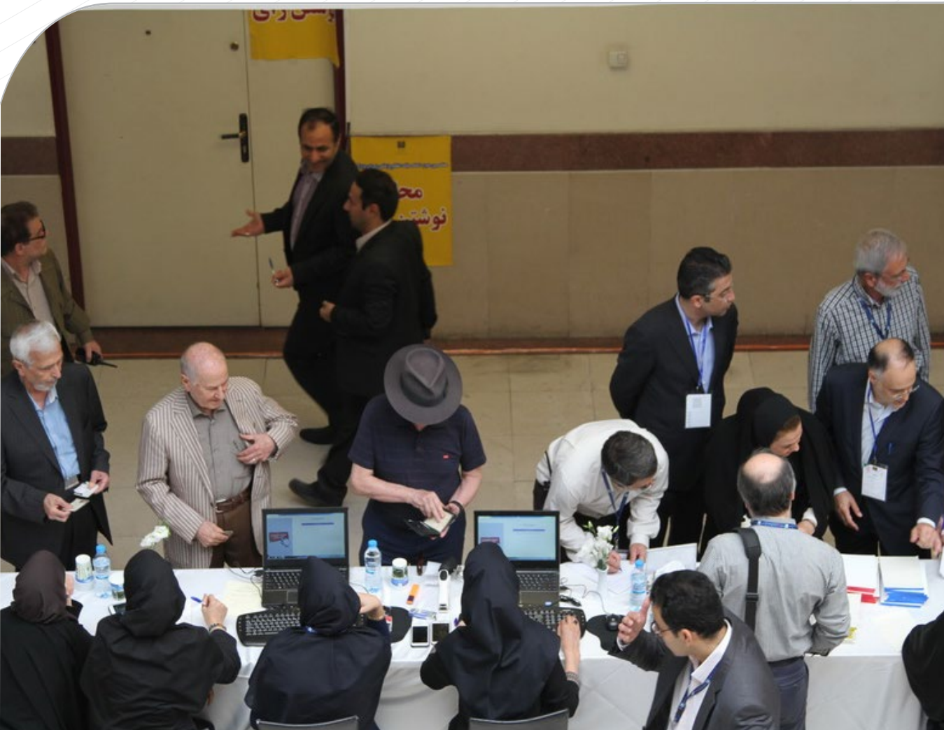
هفتمین دوره انتخابات نظام پزشکی تهران به میزبانی دانشگاه برگزار شد