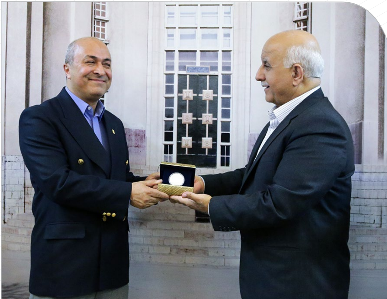
تکریم و معارفه معاونان پیشین و جدید بین الملل دانشگاه