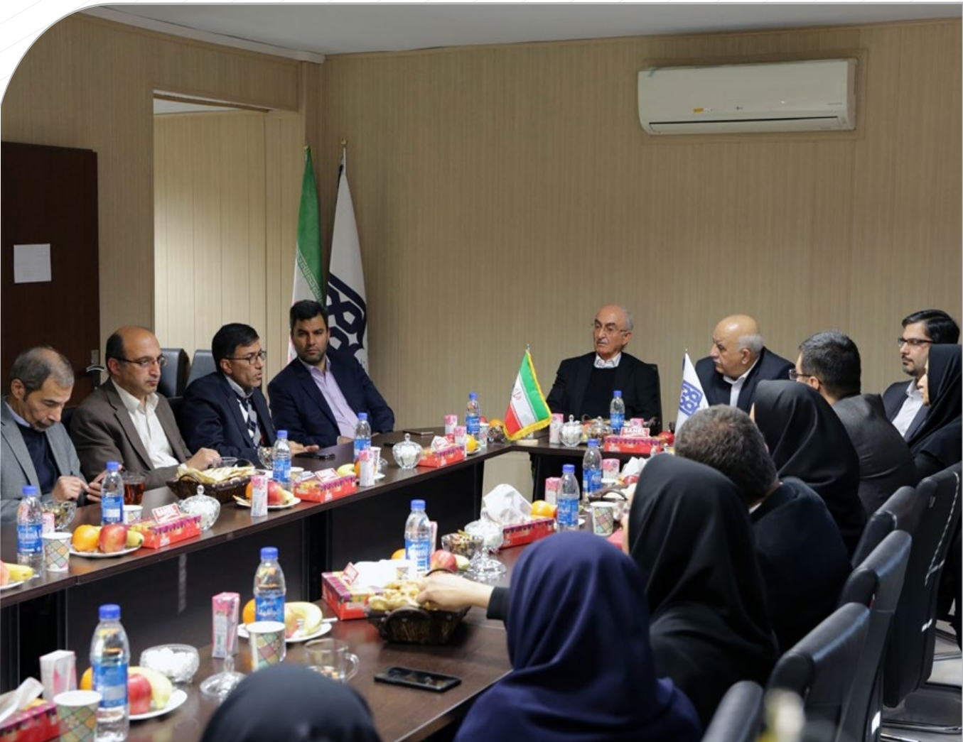
نشست رئیس دانشگاه با اعضای هیئت علمی دانشکده تغذیه و رژیم شناسی