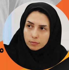
دکتر زینب نصیری مدیر کل سلامت شهرداری تهران