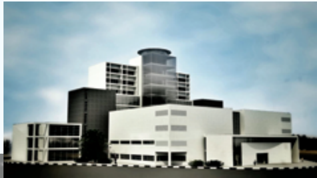
پروژه بیمارستان فارابی

TEHRAN UNIVERSITY OF MEDICAL SCIENCES & HEALTH DEVELOPMENT OF SHARIATI HOSPITAL