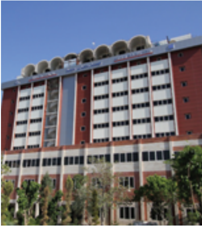
ساختمان جدید بیمارستان سینا