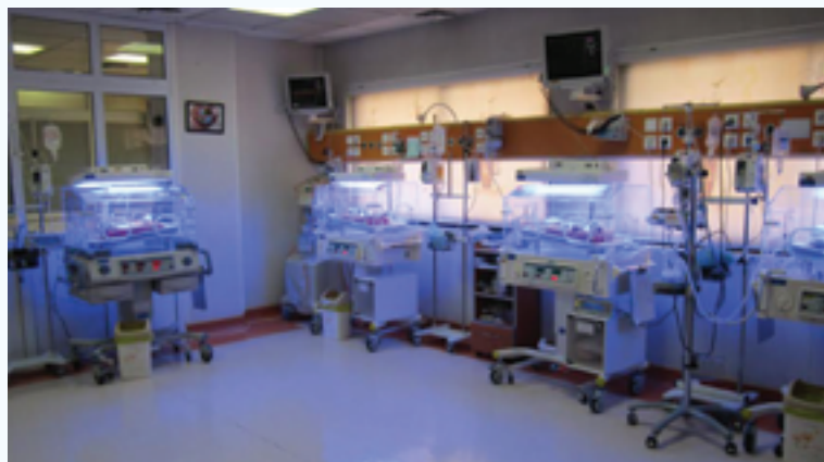
پروژه مراقبت‌های ویژه (NICU) بیمارستان آرش