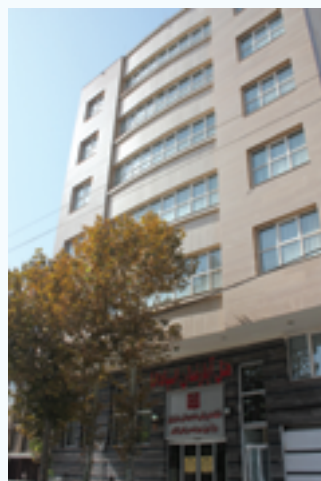
هتل آپارتمان اسپادانا