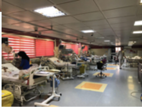
مرکز طبی کودکان ICU