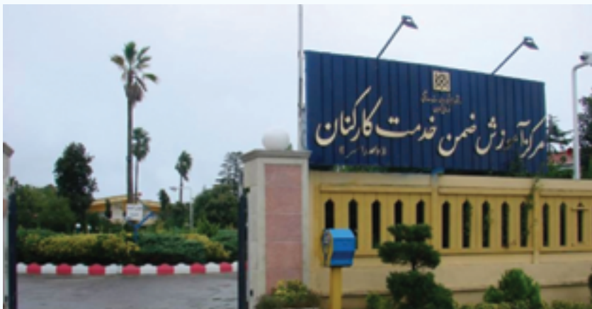
مرکز آموزشی فرهنگی کارکنان رامسر