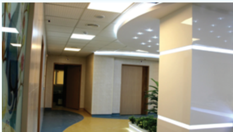
پروژه بلوک زایمان بیمارستان آرش