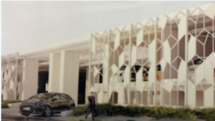
پروژه پارکینگ طبقاتی بیمارستان امام خمینی (ره)