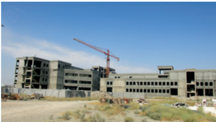
پروژه بیمارستان اسلامشهر