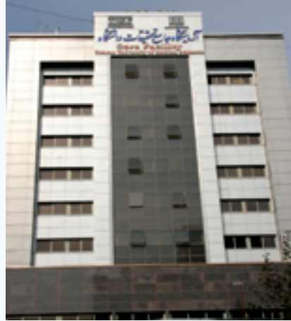
آزمایشگاه جامع تحقیقات دانشگاه