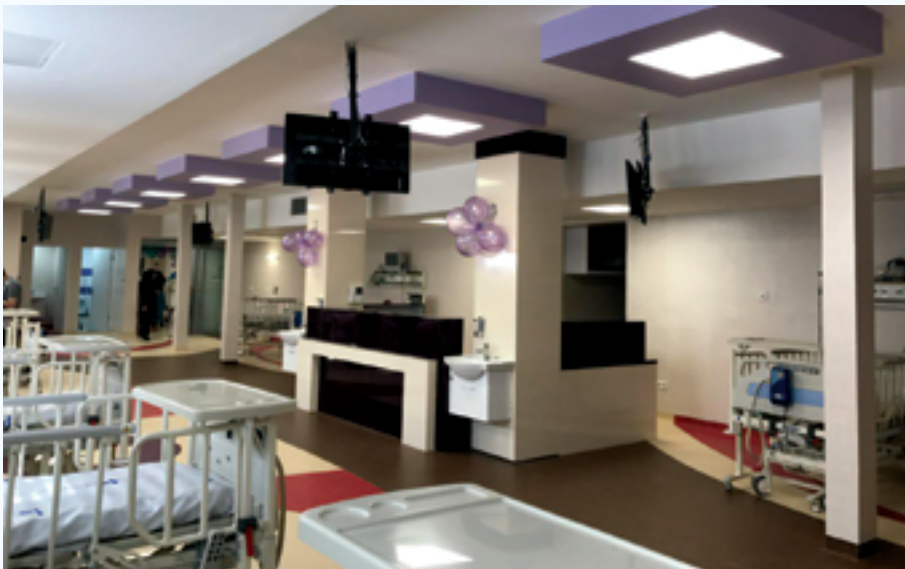
پروژه مراقبت‌های ویژه (PICU) بیمارستان مرکز طبی کودکان