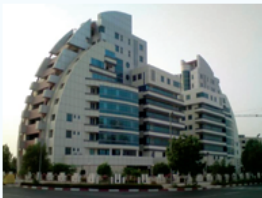
مجتمع اقامتی سارا در جزیره کیش