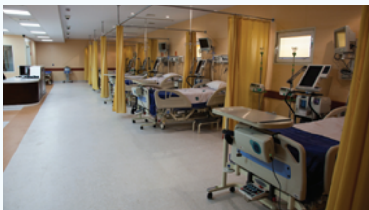
پروژه مراقبت‌های ویژه (ICU) بیمارستان امیراعلم