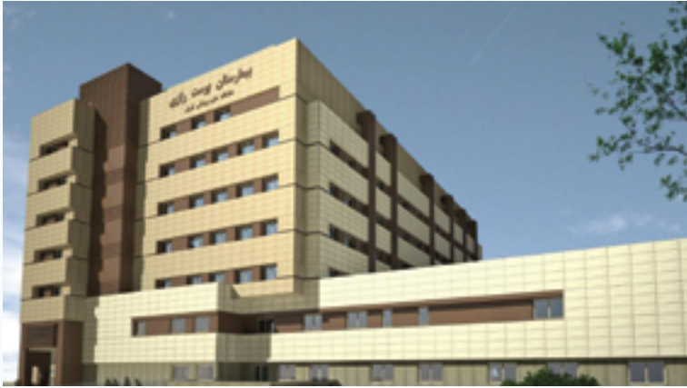
پروژه ساختمان جدید بیمارستان پست رازی