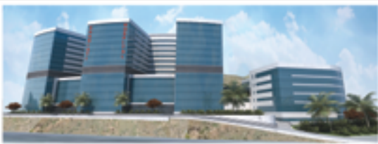
پروژه بزرگ بیمارستان شریعتی شماره ۲

TEHRAN UNIVERSITY OF MEDICAL SCIENCES & HEALTH DEVELOPMENT OF SHARIATI HOSPITAL