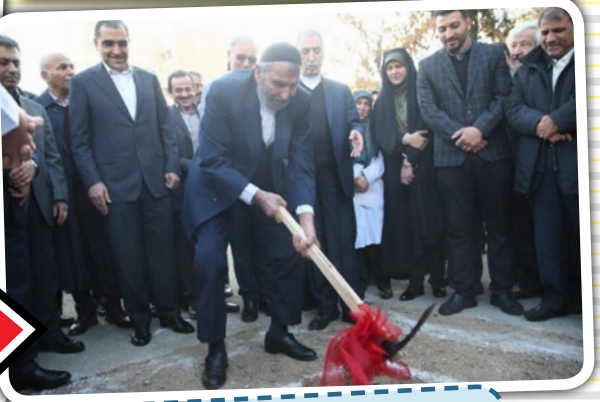
کلنگ زنی اولین و مجهزترین بیمارستان فوق تخصصی MS در خاورمیانه پنجشنبه ۷ دی ۹۶ - بیمارستان سینا