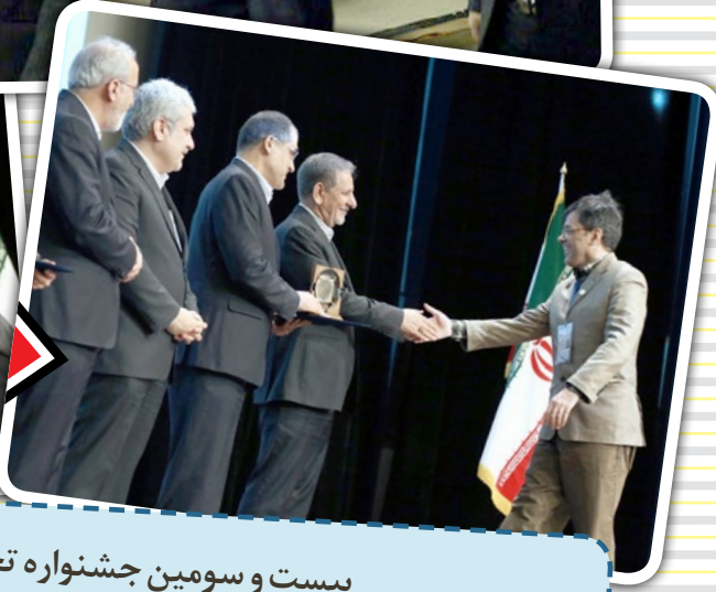
بیست و سومین جشنواره تحقیقاتی علوم پزشکی رازی دوشنبه ۲۵ دی ۹۶ - تالار امام دانشگاه علوم پزشکی شهید بهشتی