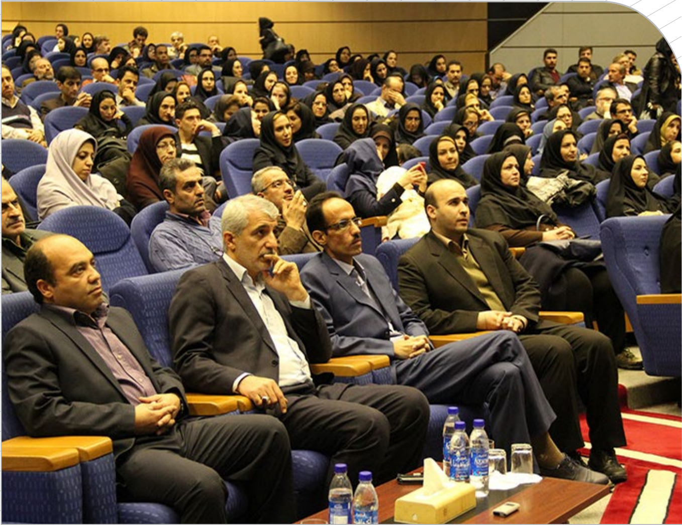
قدردانی از ۹۰۰ کارمند حوزه مالی دانشگاه