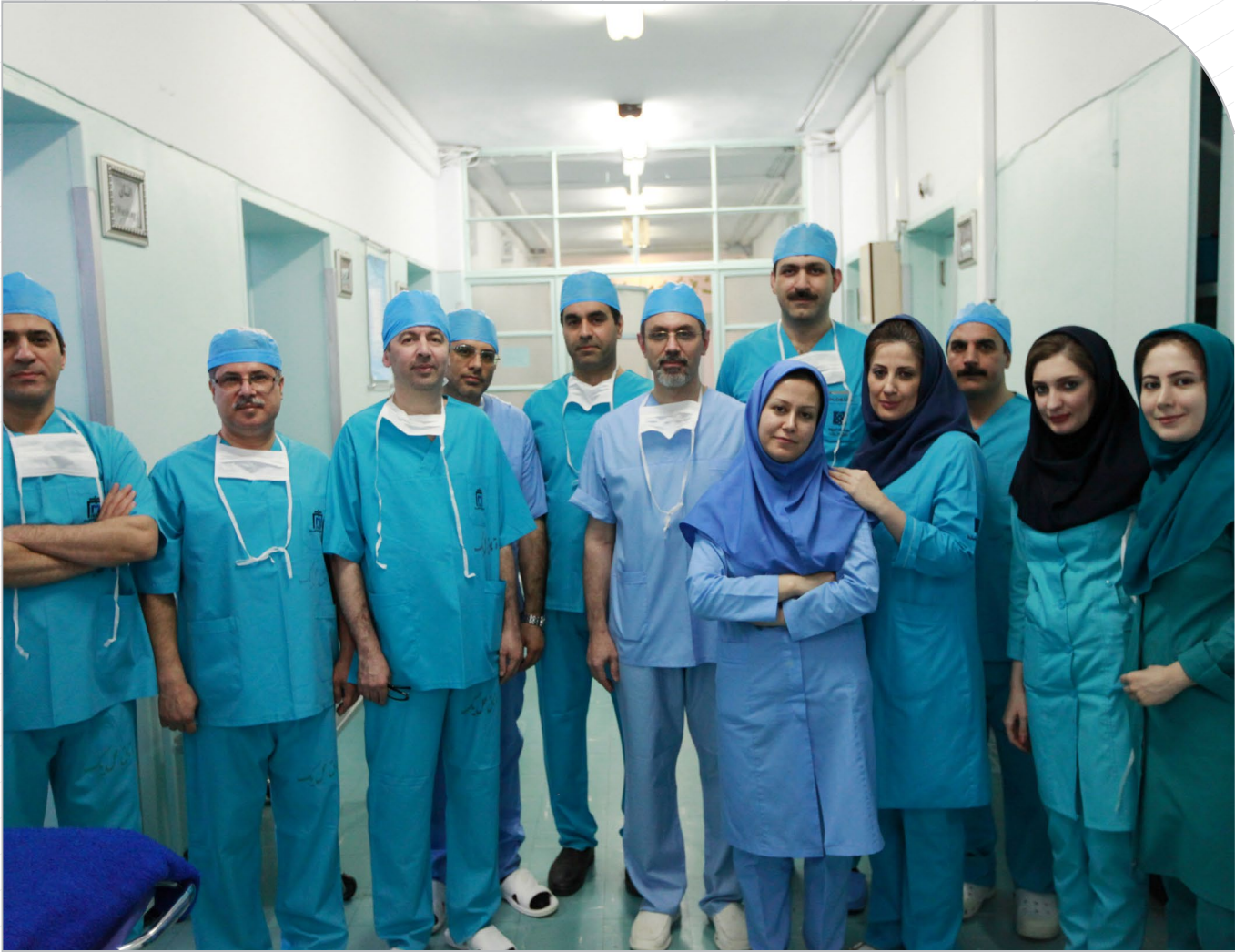
گزارشی از یکصدمین جراحی پیوند کبد در سال ۹۴