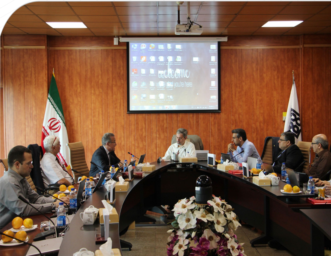
اذعان پروفیسور لینسٹر بر کیفیت بالای آموزش دوره پزشکی عمومی دانشگاه