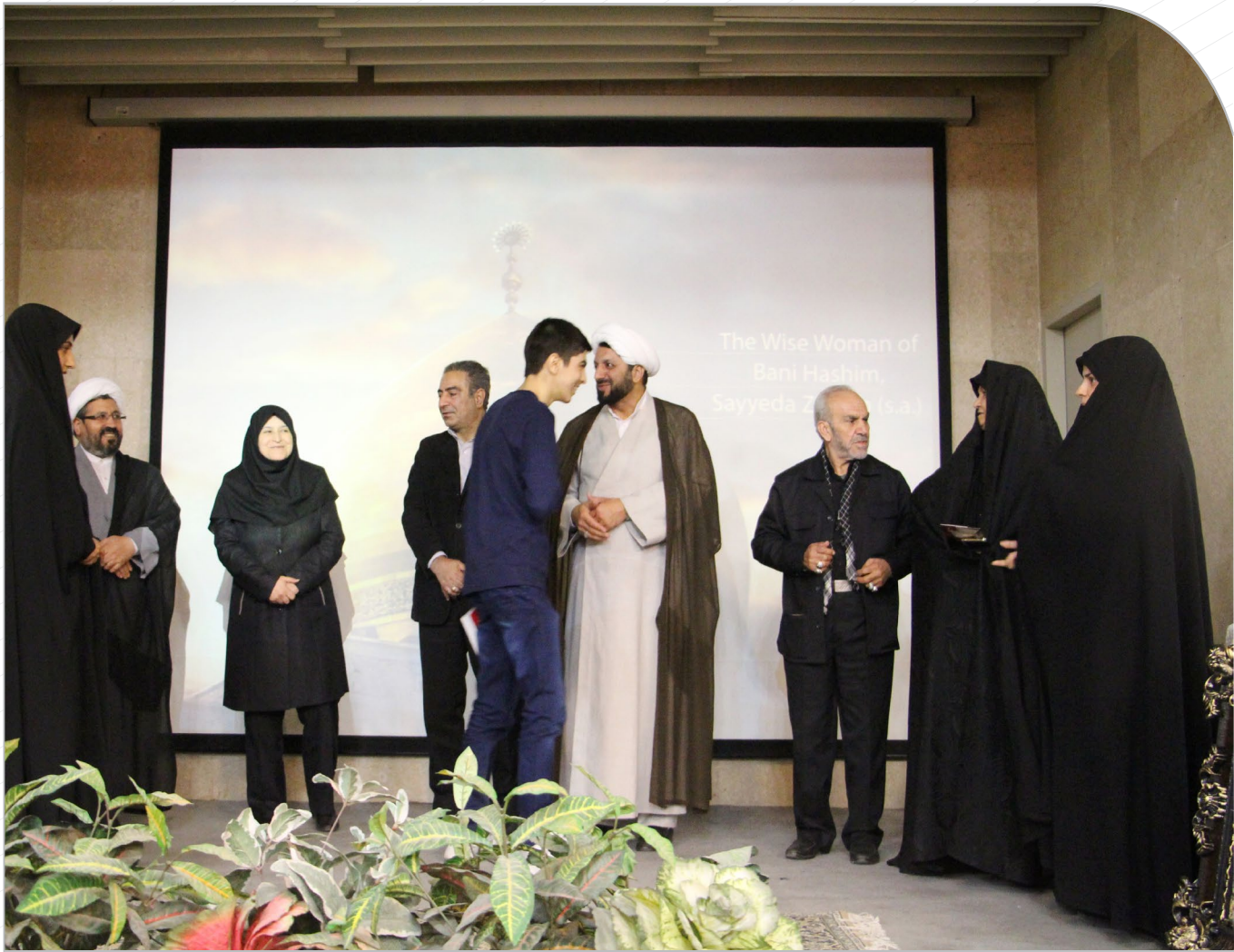
مرتب‌ه ویژه شهدا رسیدن به مقام رفاقت و تقرب با خداست