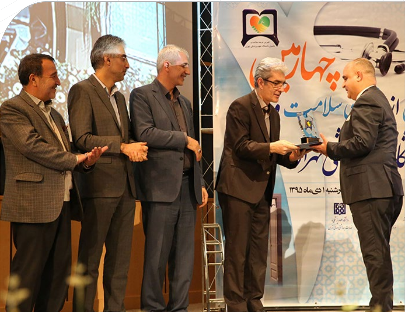
تجلیل از ۱۵ خیر سلامت دانشگاه علوم پزشکی تهران