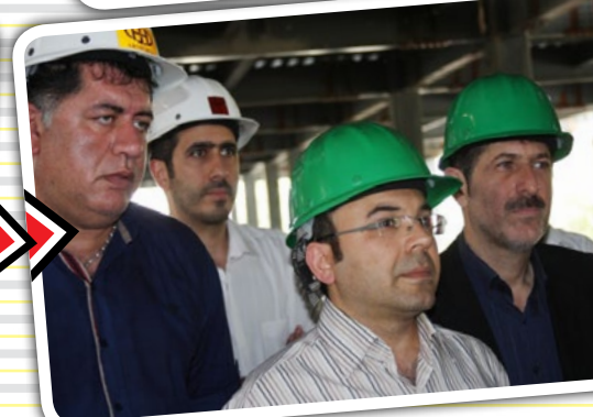
بازدید رئیس دانشگاه و تیم همراه از ۱۵ پروژه عمرانی شنبه ۷ مرداد ۹۶