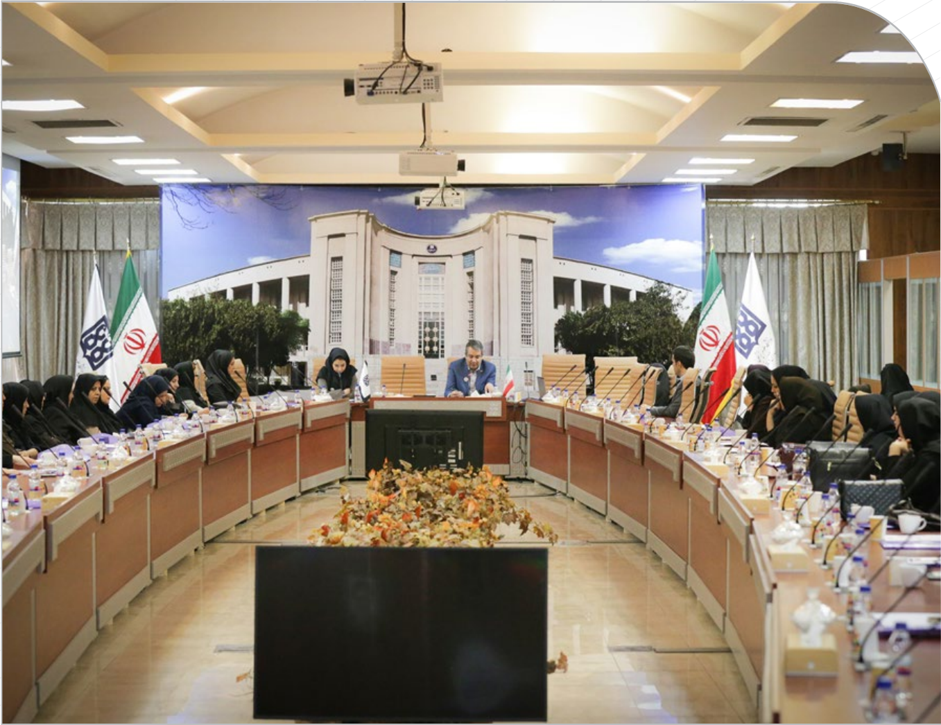
قدردانی از کتابداران برگزیده