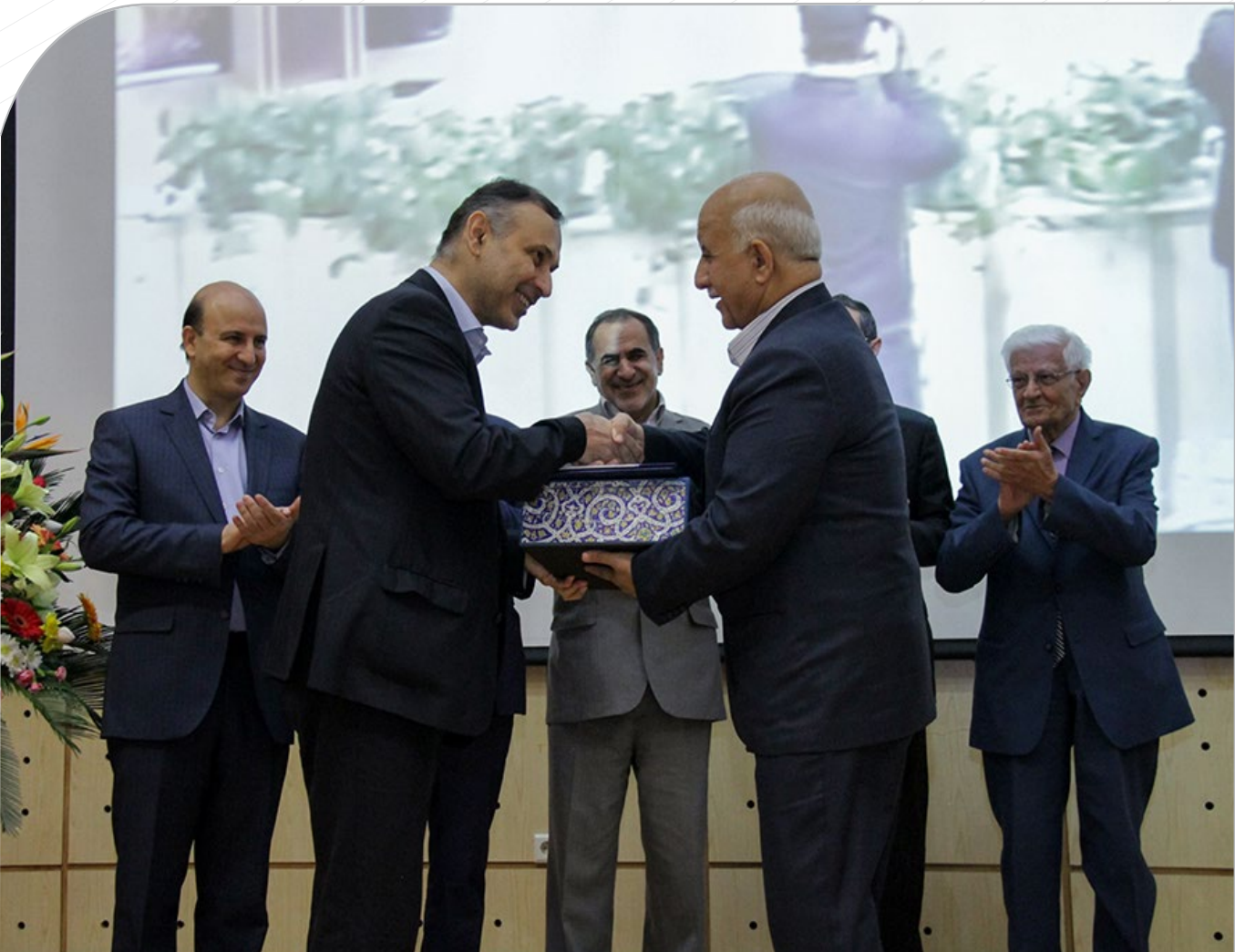
مراسم تکریم و معارفه روسای پیشین و جدید مجتمع بیمارستانی امام خمینی (ره) برگزار شد