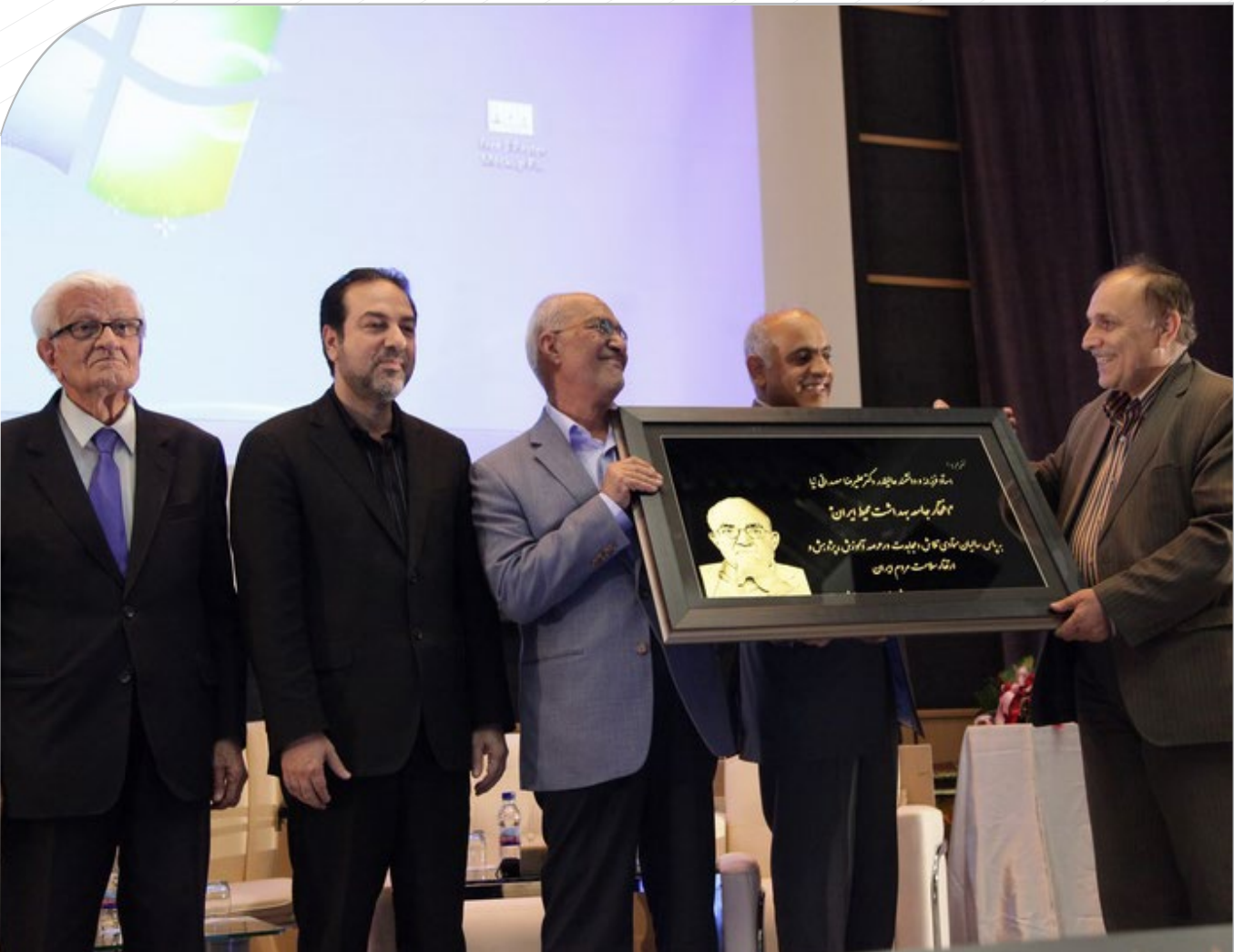
دومین کنفرانس ملی توسعه پایدار سلامت