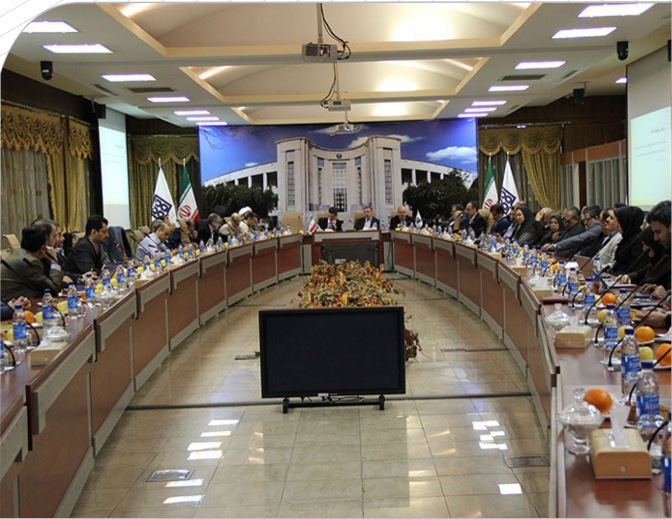
سیزدهمین جلسه دوره چهارم شورای دانشگاه با بررسی ۵ دستور جلسه برگزار شد