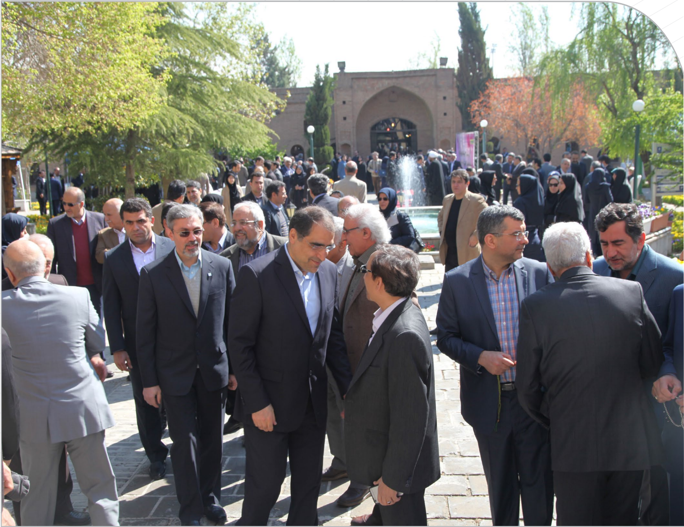
دیدار نوروزی ۹۵ در هوای مطبوع بهاری با حضور وزیر بهداشت برگزار شد