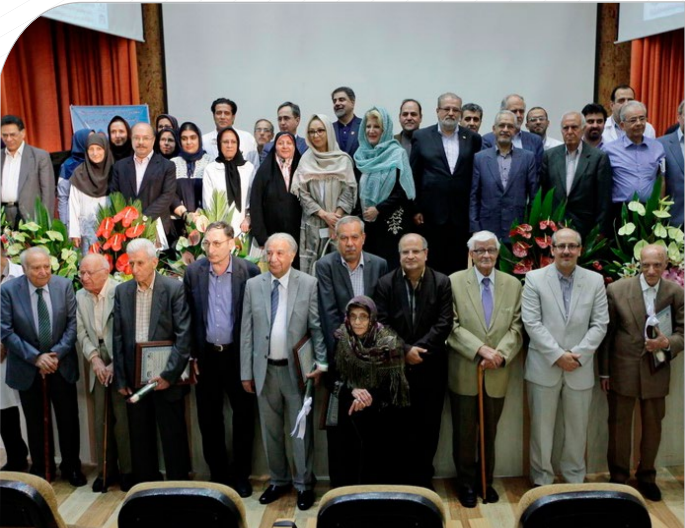
مراسم بزرگداشت اساتید برجسته گروه داخلی مجتمع بیمارستانی امام خمینی ع