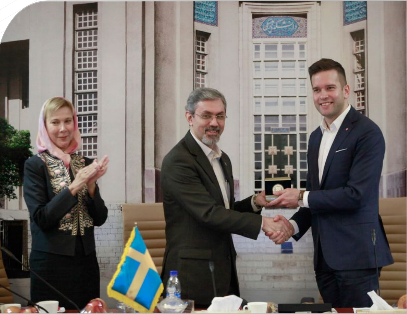
میزبانی دانشگاه علوم پزشکی تهران از هیئت سوئدی