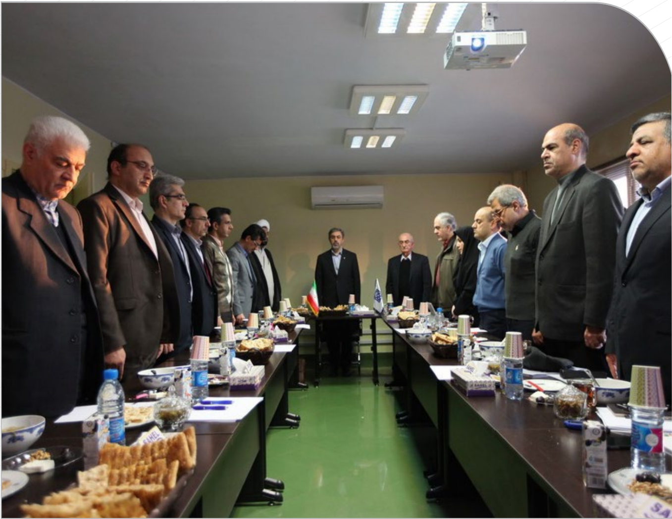
بهبود فضای فیزیکی آزمایشگاه دانشکده تغذیه و راهاندازی بخش تغذیه بالینی در بیمارستان‌ها