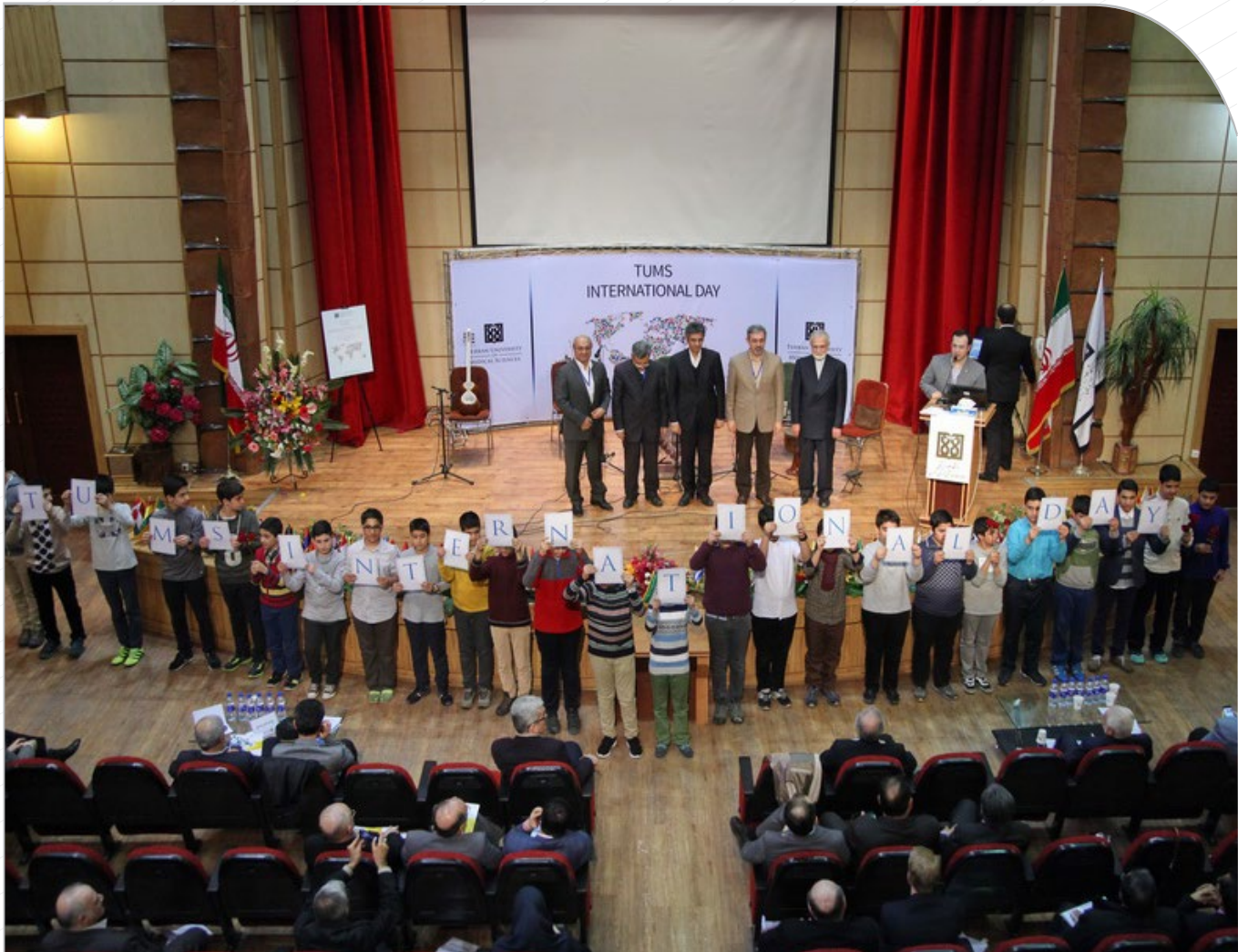
با تأکید بر افزایش تبادل ارتباطات علمی و پزشکی در عرصه‌های بین‌المللی