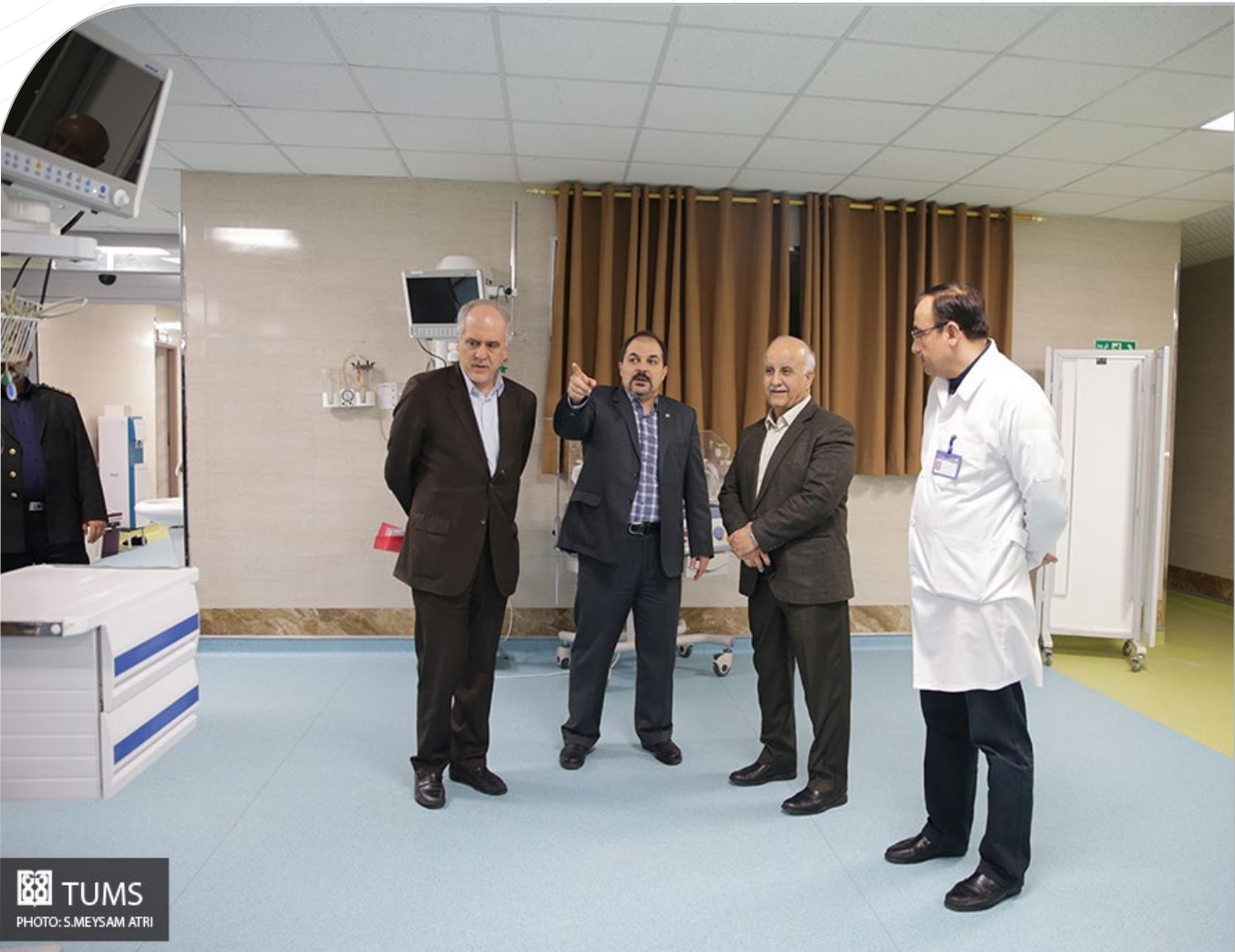
بازدید رئیس دانشگاه از بیمارستان بهرامی