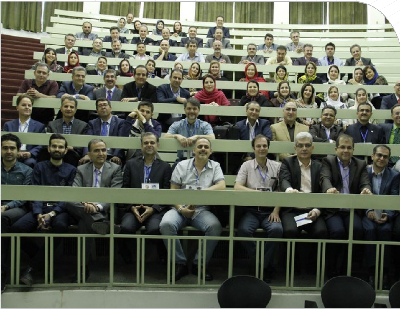
لحظه‌های دوران دانشجویی پس از ۳۰ سال تکرار شد