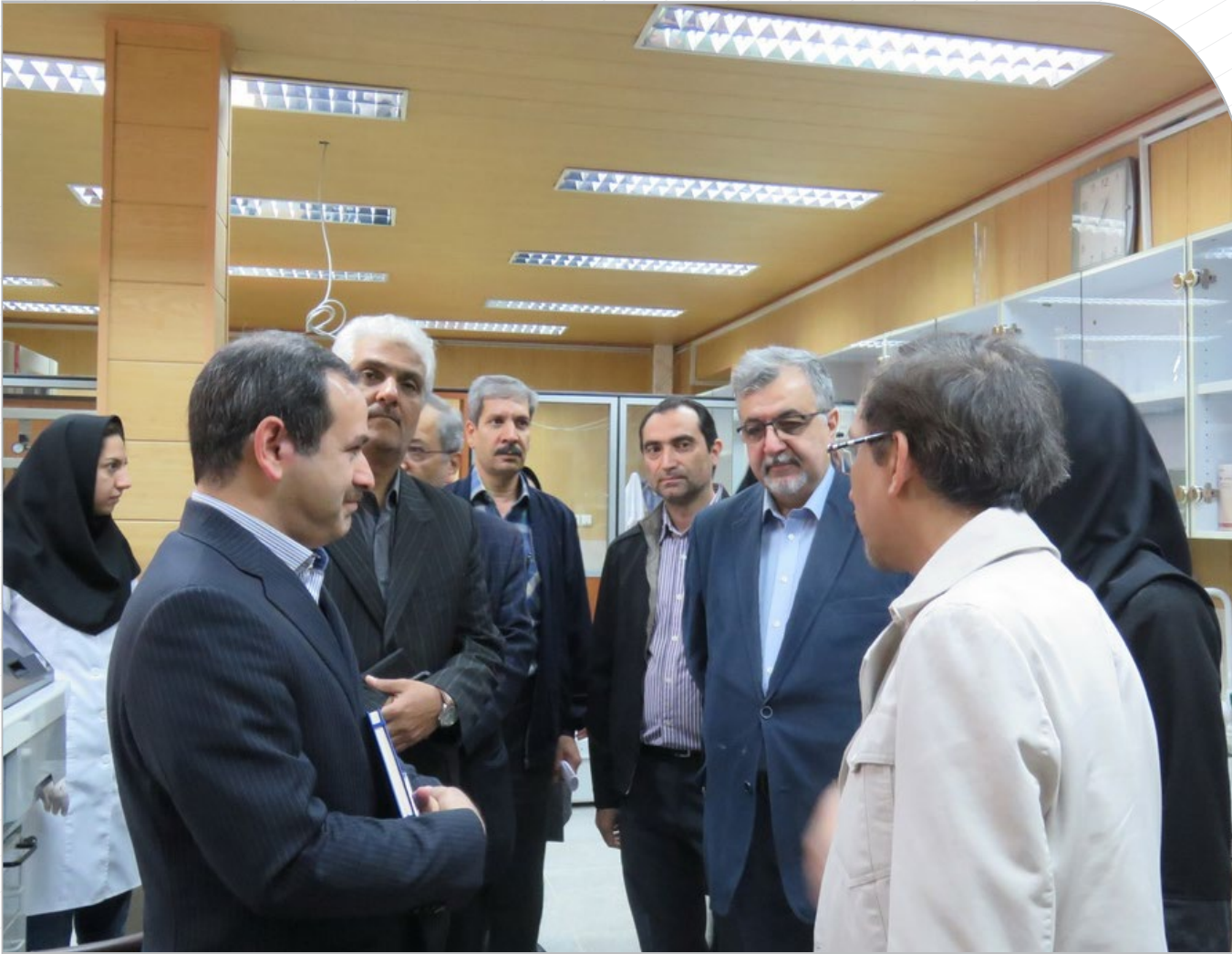
تأکید بر همبستگی و تعامل بیشتر پژوهشکده و دانشکده دندانپزشکی