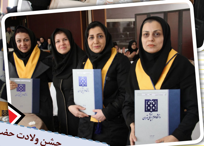
جشن ولادت حضرت زینب (س) و روز پرستار ۲۵ بهمن ۹۴ مرکز طبی کودکان