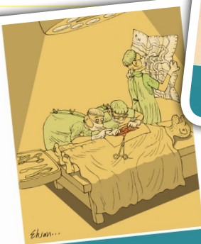
رتبه ی سوم بخش کاریکاتور : احسان گنجی