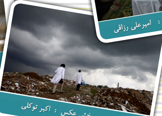
رتبه ی دوم بخش عکس : اکبر توکلی